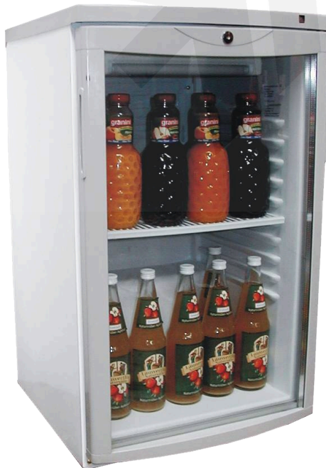
Abb.: L 140 G

Ö Ō œ Ō ^ dē } \ \ | > @ & @ a \ Š F I € Ō Á } a Š F I | Ō Á ^ š ē | c Ō Ō : | a Š ē | c Ō Ō : | a Ō Ō : | a F G G E J Ō Ō : | a Ō Ō : | a Ō Ō : | a Ō Ō : | a Ō Ō : | a Ō Ō : | a Ō Ō : | a Ō Ō : | a