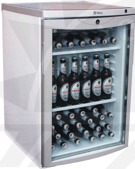
Abb.: L 145 G