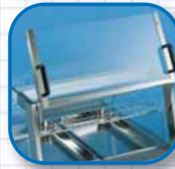
Bedienseite mit hochklappbarer Scheibe