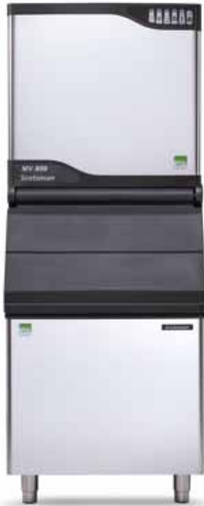
MV806 mit SB530 (separater Verkauf)