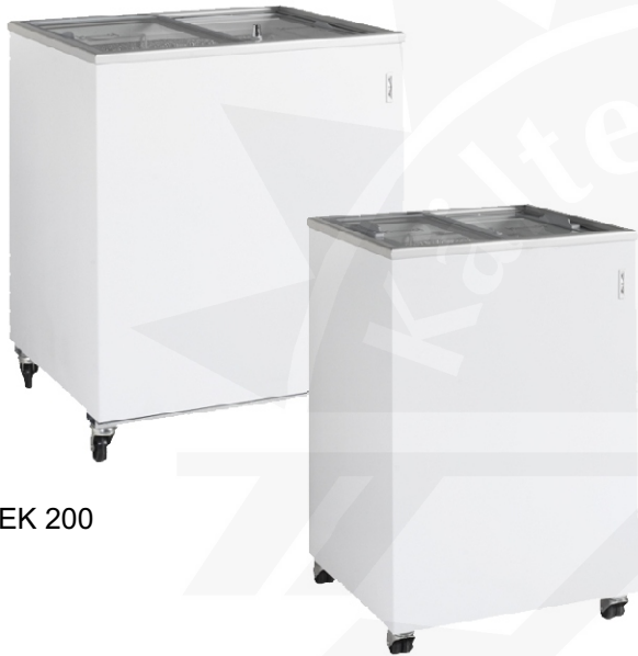
Abb.: EK 200