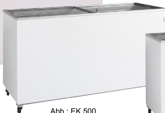
Abb.: EK 500