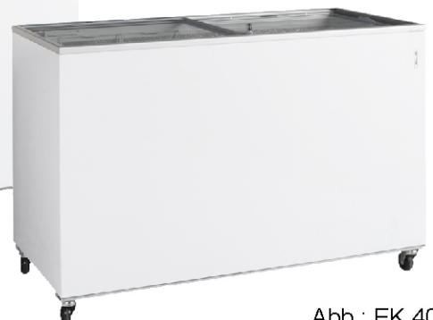
Abb.: EK 400