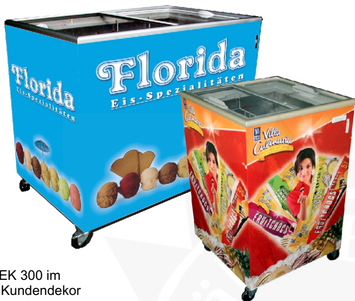
Abb.: EK 300 im Kundendekor