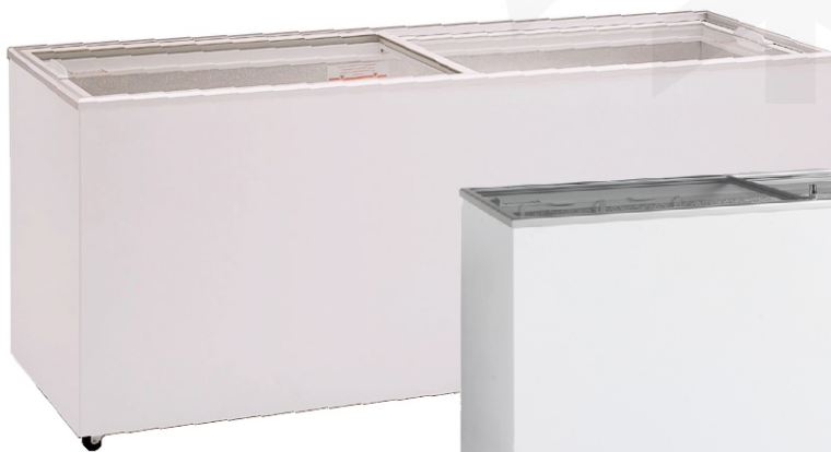
Abb.: EK 700