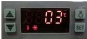
Steuerung mit gut sichtbarer Temperaturanzeige