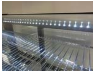
Angenehme Innenbeleuchtung durch LED