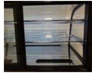
Einblick-Bedienerseitig, lichte Öffnung 360 mm