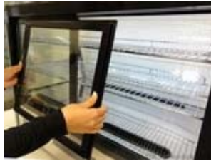
Schiebescheiben zur Reinigung leicht herausnehmbar