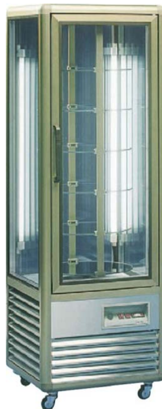
Snelle 350 R (Bronze)