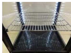
Serienmäßig mit engmaschigen Rosten, Boden des Gerätes kann