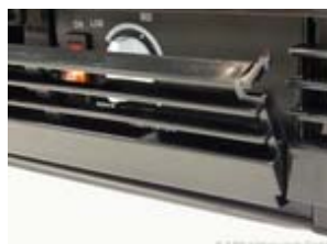
Frontpanel abklappbar, dadurch Zugang zu der Temperaturregeleinheit,