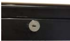
Tür mit Schloß