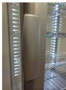
Leichtes öffnen der Tür durch aufgesetzten Griff

Temperaturregeleinheit, des Lichtschalters, sowie einfache Reinigung des Kondensators möglich