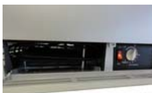
Frontpanel abklappbar, dadurch Zugang zu der