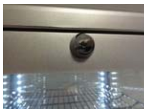
Tür mit Schloss