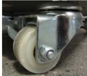
4 Rollen davon 2 mit Feststellern

Copyright © 2006 KBS Kältetechnik GmbH. powered by Red4Net®