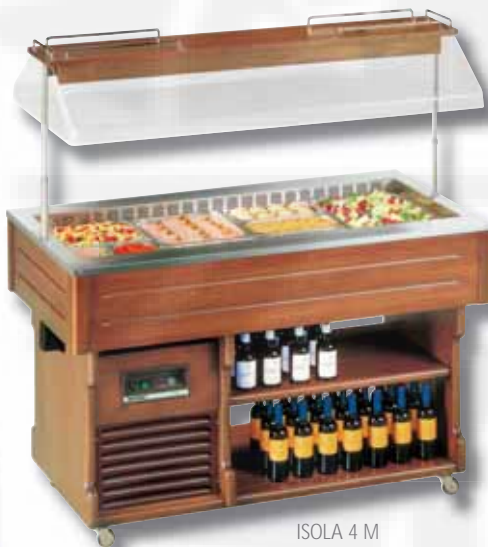
ISOLA 4 M