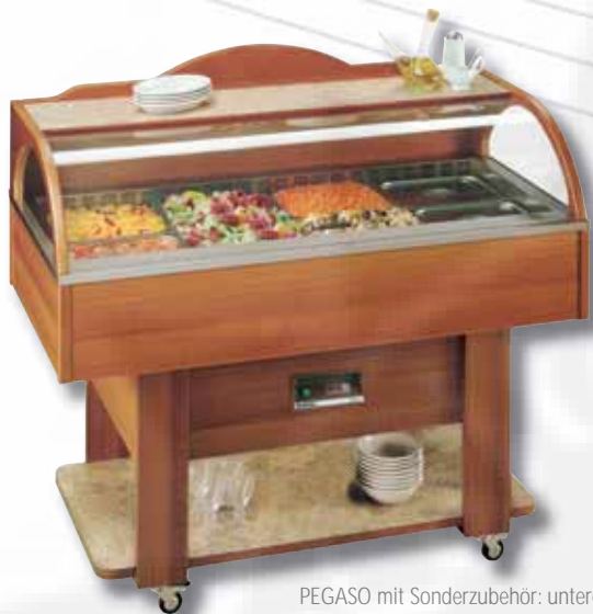
PEGASO mit Sonderzubehör: unteres Ablagebord