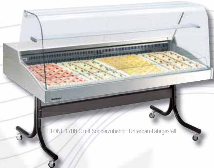
TIFONE 1700 C mit Sonderzubehör: Unterbau-Fahrgestell