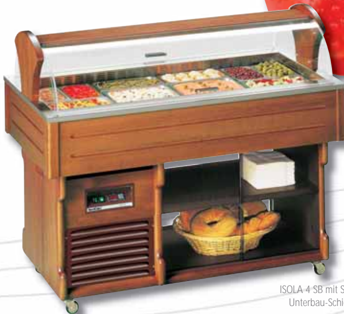
ISOLA 4 SB mit Sonderzubehör: Unterbau-Schiebescheiben