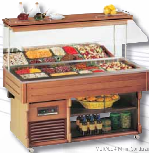
MURALE 4 M mit Sonderzubehör: Unterbau-Schiebescheiben