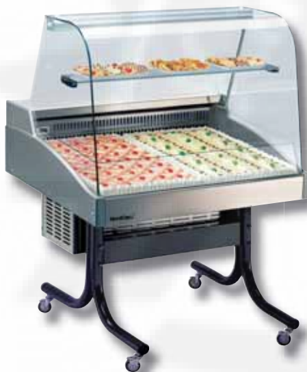
BORA 900 mit Sonderzubehör: Unterbau-Fahrgestell