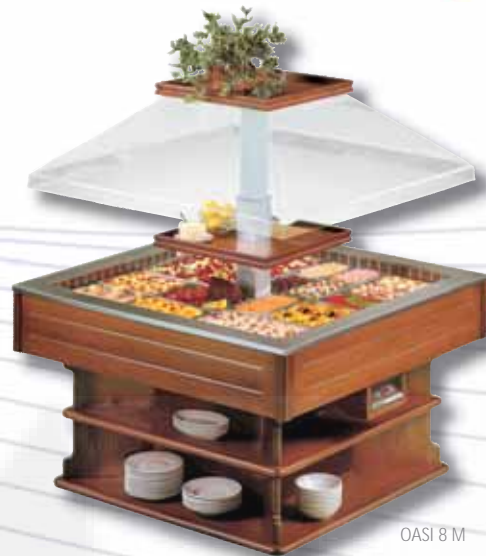
OASI 8 M