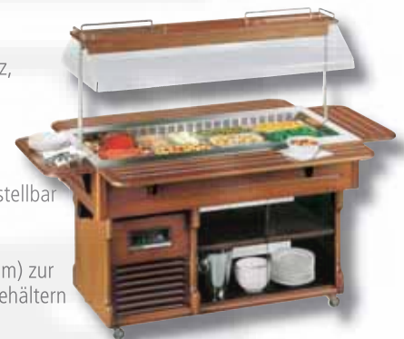
ISOLA mit Sonderzubehör: Tablettrutschen und Unterbau-Schiebescheiben