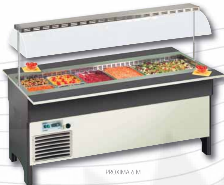
PROXIMA 6 M