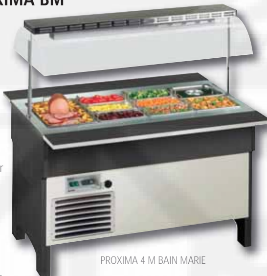
PROXIMA 4 M BAIN MARIE