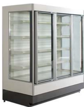
Optimer 1946 G