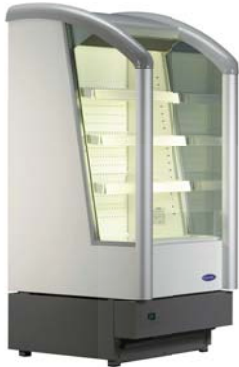
Presenter 0646/ Presenter 0647