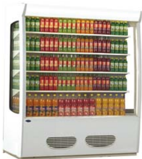
Maxima M 17 Deluxe