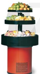
Sales Maker SMM 30 *

Sales Maker SMM 30 Nettovolumen 160 l Displayfläche 0,8 m 2 Außenmaße (HxØ) 1320x760 mm Gewicht brutto/netto 73/65 kg