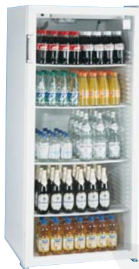
UK 500 GL