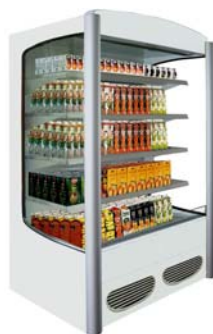
Maxima M 13 Horizon