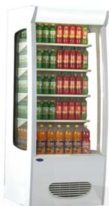
Maxima MC 7 Deluxe