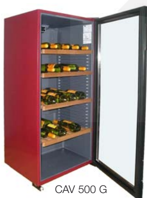
CAV 500 G