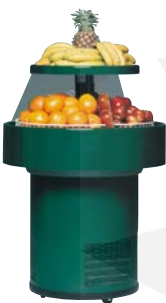
Sales Maker SMM 20 *

Sales Maker SMM 20 Nettovolumen 90 l Displayfläche 0,5 m 2 Außenmaße (HxØ) 1080x760 mm Gewicht brutto/netto 67/60 kg