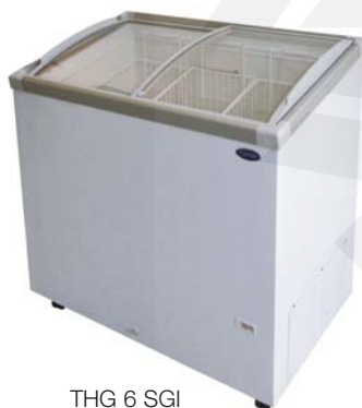
THG 6 SGI