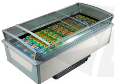
Multinor 2060/80 G mit Dekor Seiten- teilen (Zubehör)