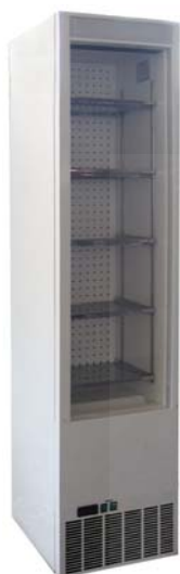
Slim Cooler 0430