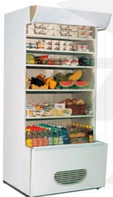
Maxima M 9 Standard