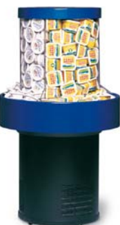
Sales Maker SMM 50 *

Sales Maker SMM 50 Nettovolumen 150 l Displayfläche 1,0 m 2 Außenmaße (HxØ) 1380x760 mm Gewicht brutto/netto 77/69 kg