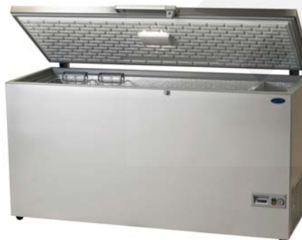
CGT 500 STS