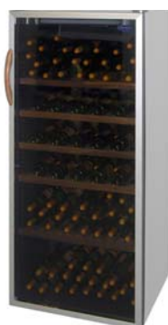
CAV 500 GL Superior