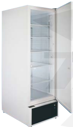
LF J 650 W