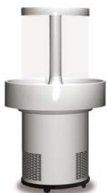
Sales Maker SMM 10

Sales Maker SMM 10 Nettovolumen 150 l Displayfläche 1,0 m 2 Außenmaße (HxØ) 1380x760 mm Gewicht brutto/netto 73/65 kg