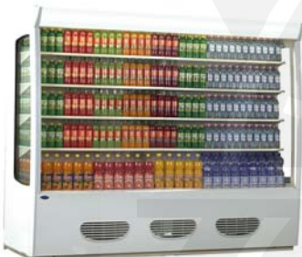
Maxima MC 25 Deluxe