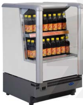
Presenter 0646 S