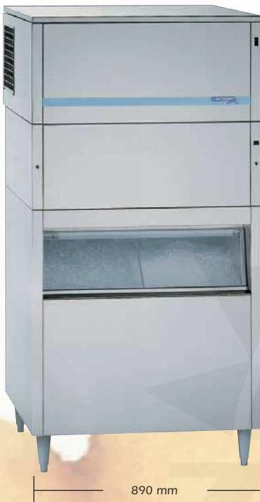
Abb. Modell W 120 ECL

Für die Produktion von Eiswürfeln und Crushed-Ice waren bisher zwei Eisbereitungsmaschinen erforderlich. Oder die Eiswürfel mußten mühsam von Hand oder mit einem separaten Crusher zerkleinert werden. Das gastronomiegerechte Konzept der Combi-Line ermöglicht aufgrund seiner modularen Bauweise die Herstellung beider Eisvarianten mit einer einzigen Komplettlösung. Das reduziert die Anschaffungskosten und den Installationsaufwand und spart viel Platz.