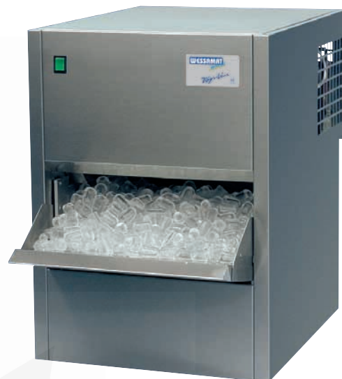
Abb. Modell W 31 L/W

Eine besondere Variante für den Einbau in Theken und gastronomische Systemmöbel stellen die luftgekühlten Maschinen (LE-Modelle) der Top-Line dar. Aufgrund des intelligenten Belüftungssystems mit integriertem Querstromlüfter ist bei diesen Geräten auch bei vollständigem Einbau eine optimale Luftzirkulation gewährleistet.