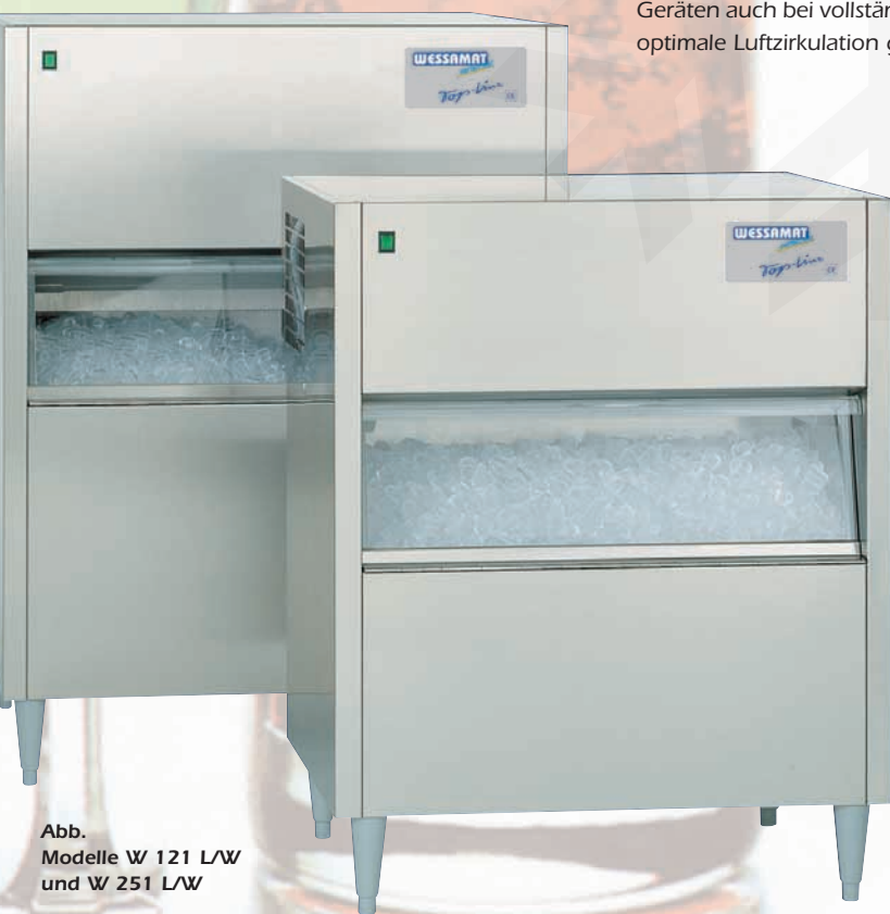
Abb. Modelle W 121 L/W und W 251 L/W

Mit den LE-Modellen bietet die Top-Line eine äußerst wirtschaftliche Alternative zu den einbaufähigen Eiswürfelbereitern mit Wasserkühlung.