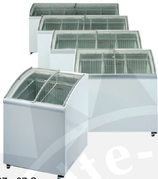
Abb.: EK 37 - 67 C