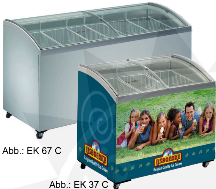
Abb.: EK 67 C

Österreich | Deutschland | Schweiz | Italien | Spanien | Frankreich | England | Belgien | Holland | Portugal | Griechenland | Türkei | Österreich