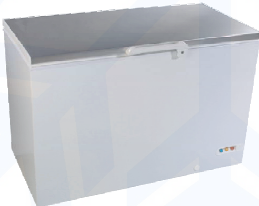
Abb.: EL 53 mit Edelstahldeckel