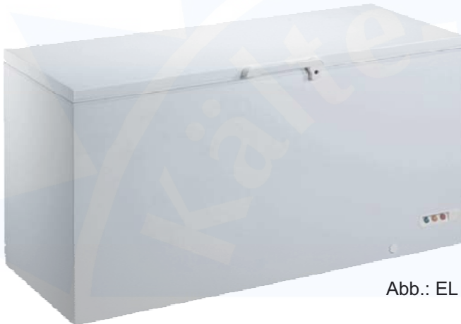
Abb.: EL 61