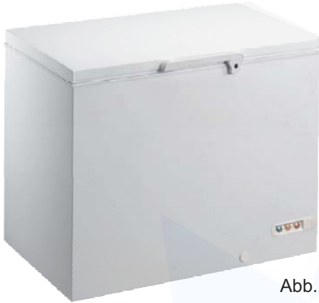
Abb.: EL 35