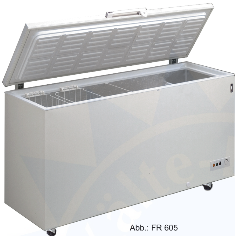
Abb.: FR 605

Österreichische Industriellenvereinigung