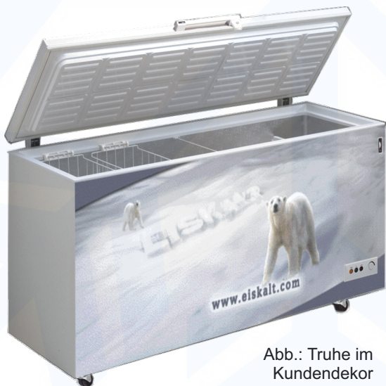
Abb.: Truhe im Kundendekor