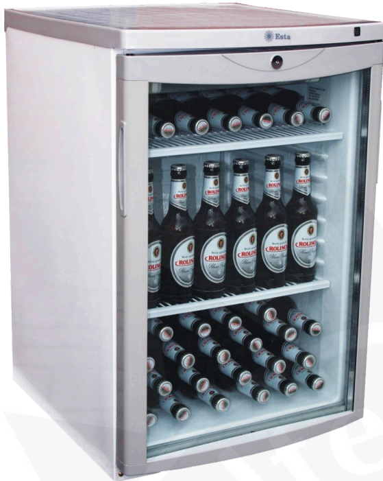
Abb.: L 145 G