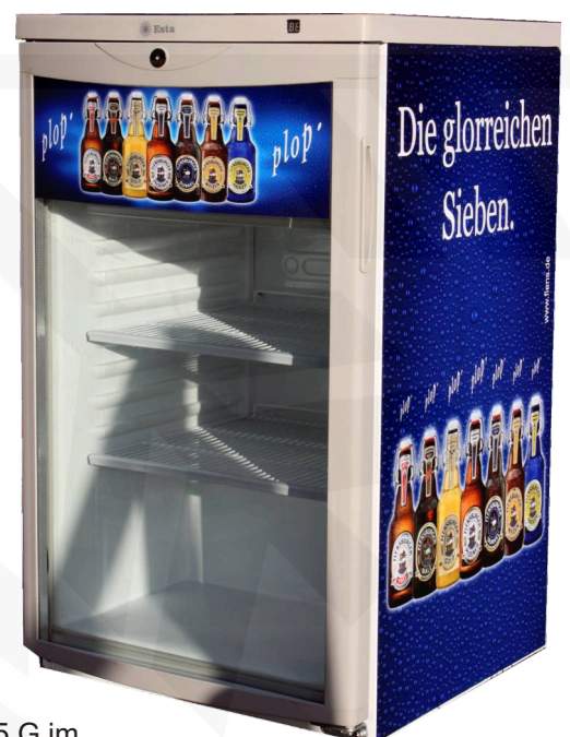
Abb.: L 145 G im Kundendekor