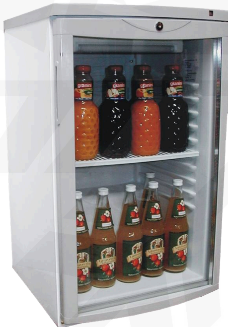
Abb.: L 140 G