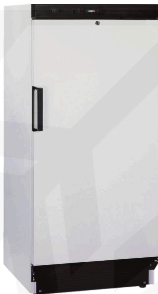
Abb.: Esta L 222 W