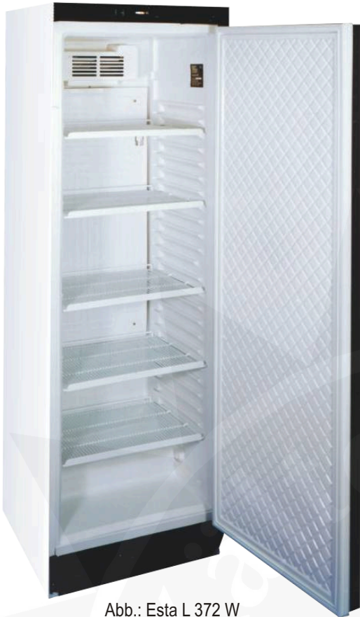
Abb.: Esta L 372 W

Ö:|Šā\Á~{ Ä•cās>@•&@ā\Á ä^•&@~{ c^|Á>|ÄŠHĪ GÄ Ä^āsē|c^EÖ^|jä