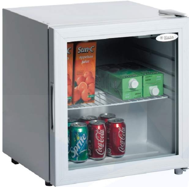
Abb.: Esta L50 G