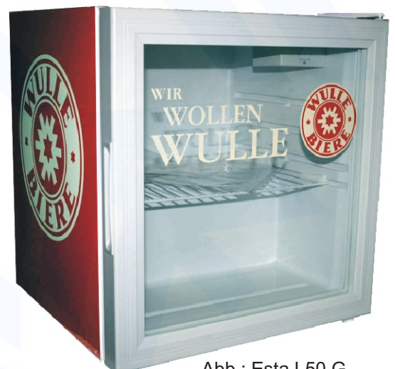
Abb.: Esta L50 G im Kundendekor