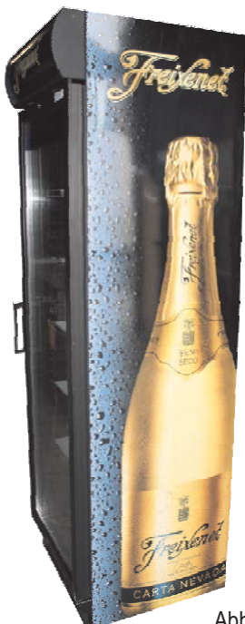
Abb.: Esta L 372 GLSS im Kundendekor