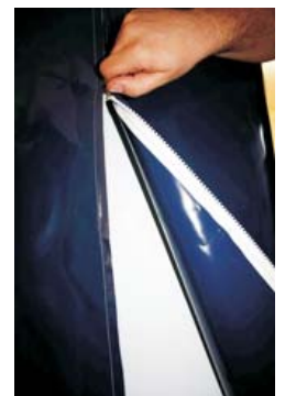
Abb.: Schutz- und Transporthülle Ösen und Reisverschluss sind optional erhältlich