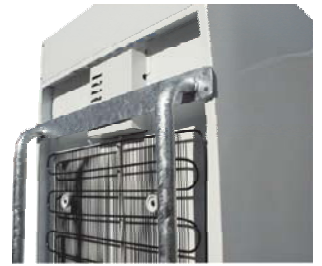
Abb.: Schutz- und Transportbügel