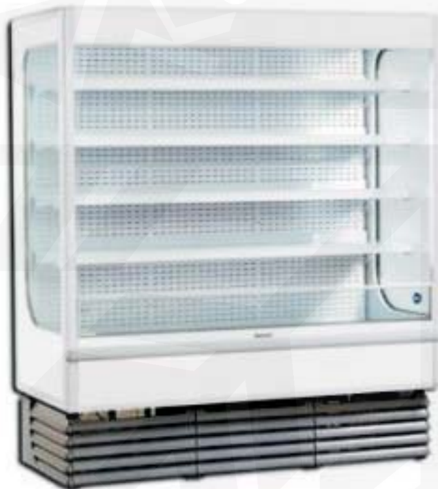
Abb.: Shelly 120