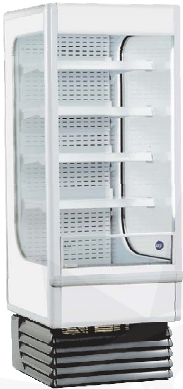
Abb.: Shelly 70

Ö:Ää \ Á { Ä} Á æ à > @ ^ * æ Å @ || ^ Á € Á ^ ä Sê | c Ö \ i | ä