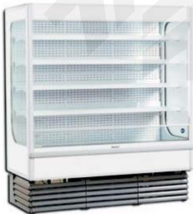
Abb.: Shelly 120

Öv|Šq|Á~{ Áe|Á æ|á|>@^* æÚ@||^ Á €Á^ás|c|ÉÖv|ä Sê|c|ÉÖv|ä Öv|Šq|Á~{ Áe|Á æ|á|>@^* æÚ@||^ Á €Á^ás|c|ÉÖv|ä FGGEJ|Öv|ä Öv|Šq|Á~{ Áe|Á æ|á|>@^* æÚ@||^ Á €Á^ás|c|ÉÖv|ä Öv|Šq|Á~{ Áe|Á æ|á|>@^* æÚ@||^ Á €Á^ás|c|ÉÖv|ä ^T æ|á|>@^* æÚ@||^ Á €Á^ás|c|ÉÖv|ä Öv|Šq|Á~{ Áe|Á æ|á|>@^* æÚ@||^ Á €Á^ás|c|ÉÖv|ä