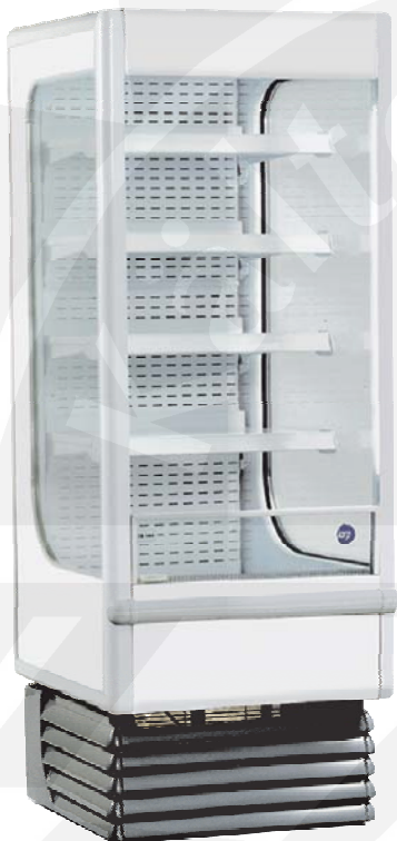
Abb.: Shelly 70

Öv|Šq|Á~{ Áe|Á æ|á|>@^* æÚ@||^ Á €Á^ás|c|ÉÖv|ä