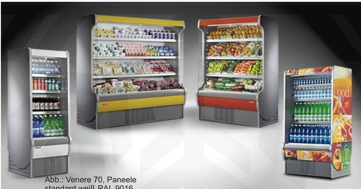
Abb.: Venere 70, Paneele standard weiß RAL 9016