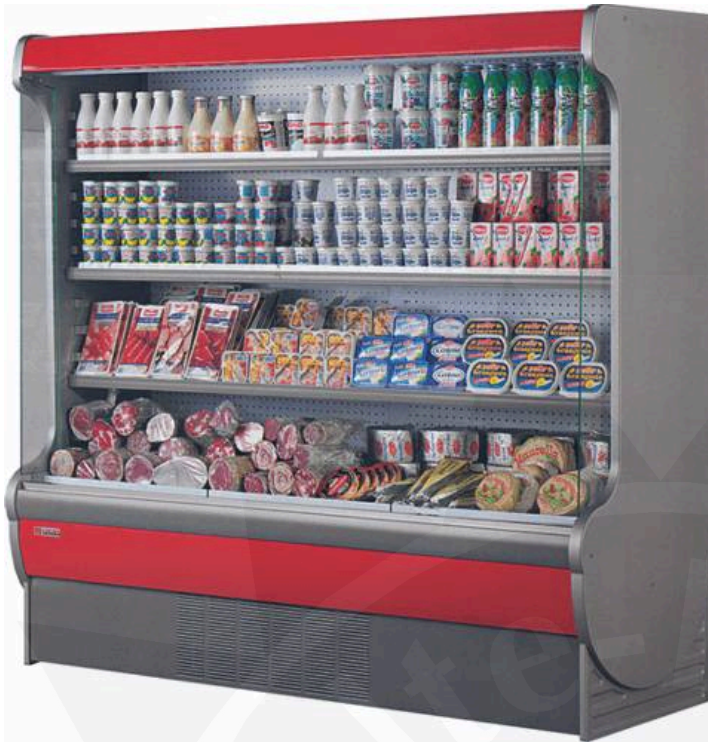
Abb.: Venere 130, Paneele rot

Ö: | S | A | A ~ { A E } ^ * A a a | > @ | ^ * a A ^ } ^ | ^ A € A ^ a S e | c E Ö | i | a