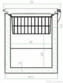
915054 915055 Seitenskizze