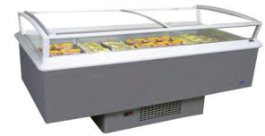
Multinor 2060/80 G