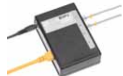
Dokumentations- u. Monitoring-Lösungen