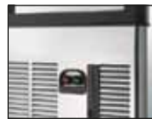
Front ON-OFF Schalter