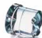
Ø 29 x H 34 mm