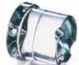
Ø 38 x H 41 mm