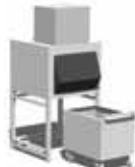
MV1006+SIS700 (separater Verkauf)