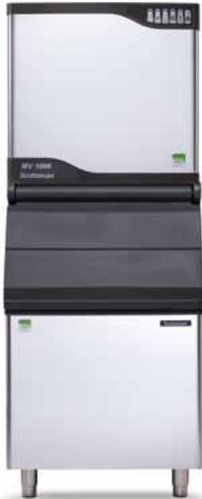
MV1006 mit SB530 (separater Verkauf)