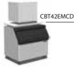
MV1006+SB550+Top (separater Verkauf)