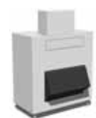
MV1006+UBH1600 (separater Verkauf)