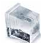
Dice Cube - 10 g B 22 x T 24 x H 22 mm