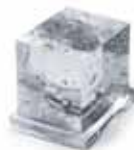
Large Cube - 17 g B 29 x T 24 x H 29 mm