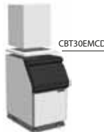
MV306+SB530+Top (separater Verkauf)