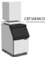
MV306+SB393+Top (separater Verkauf)