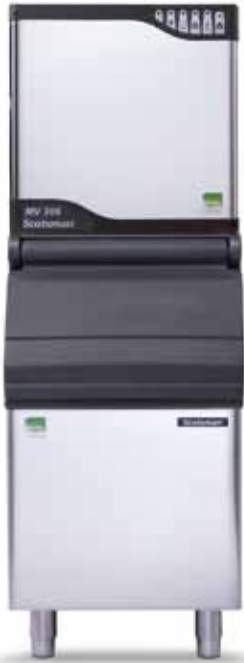
MV 306 mit SB193 (separater Verkauf)