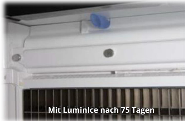
Mit LuminIce nach 75 Tagen