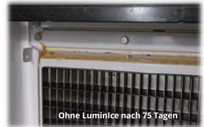
Ohne LuminIce nach 75 Tagen