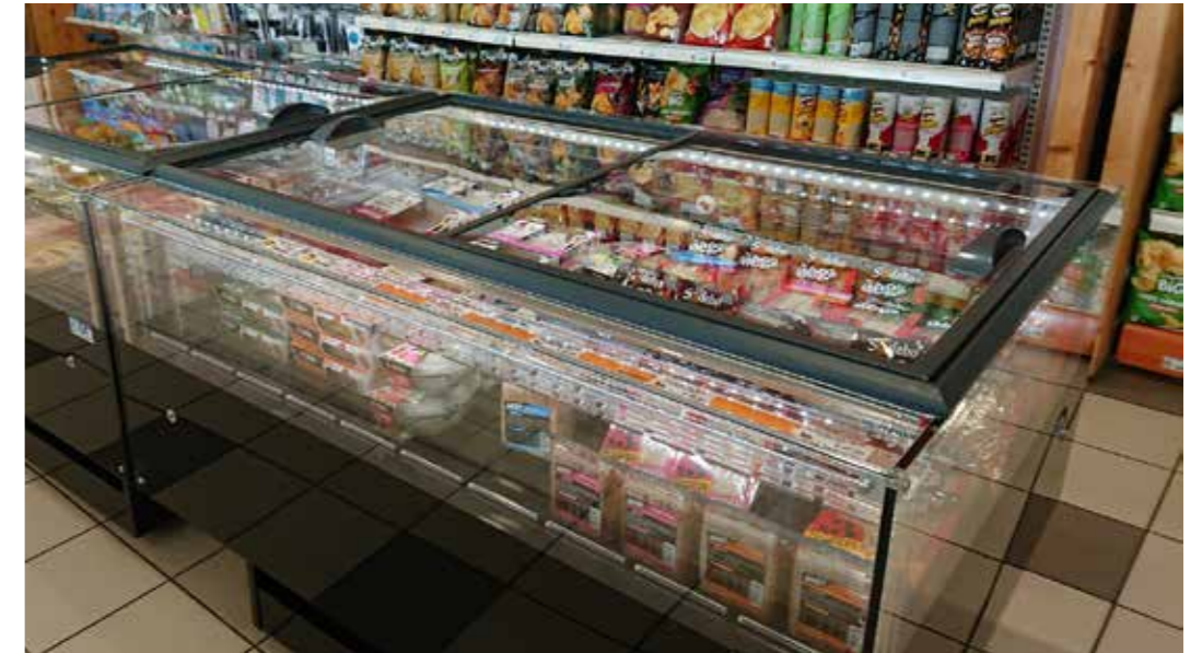
Thea with sliding lids (optional)