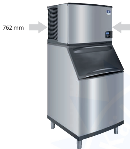
I 606 auf Speicher B 570 (optional)