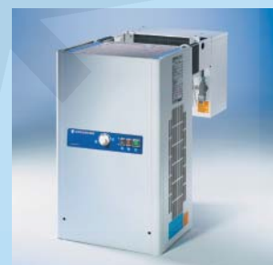
Huckepack-Aggregat mit T-Regelung

Nr. 0056 0029 02/07 • Technische Änderungen vorbehalten!