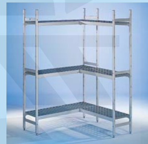
Aluminiumregal Rega Almo