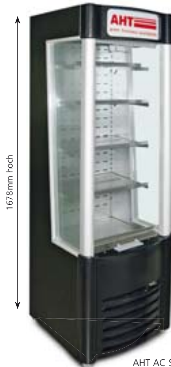
AHT AC SLIM 170