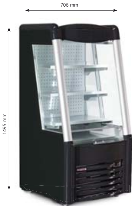
AHT AC S

Austausch der Kühlkassette innerhalb 15 Minuten