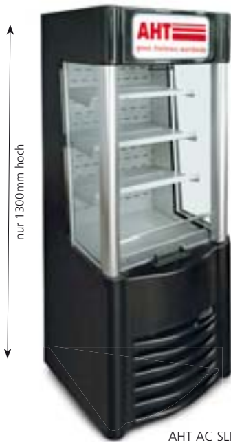
AHT AC SLIM 130

Austausch der Kühlkassette innerhalb 15 Minuten