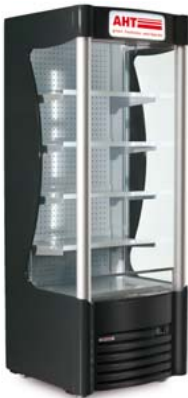
AHT AC M

*Alle Optionen auf Anfrage. Stückzahlabhängig