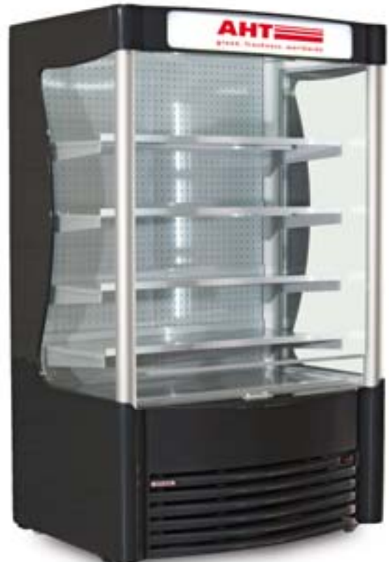
AHT AC XL

Austausch der Kühlkassette innerhalb 15 Minuten