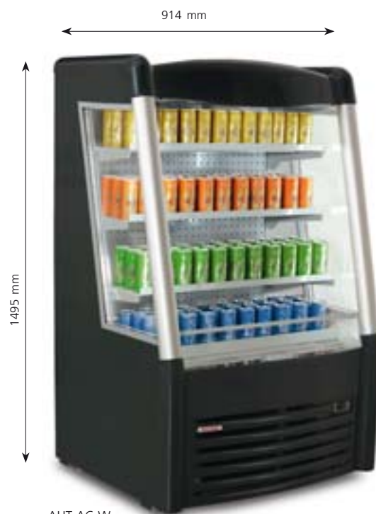
AHT AC W