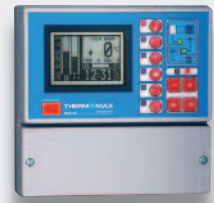
Datenlogger, Alarm & Regler SMX100