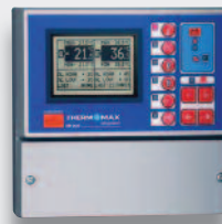
Datenlogger & Alarm SM Reihe – SM Due, Quattro & SM12