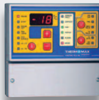
Regler & Alarm Coltrec RCX100 Regler

Die neuen Modelle THX-DL und THX-CDL stellen mit ihren erweiterten Funktionen die aktuelle Weiterentwicklung unserer bewährten Thermomax-Modellreihe dar.